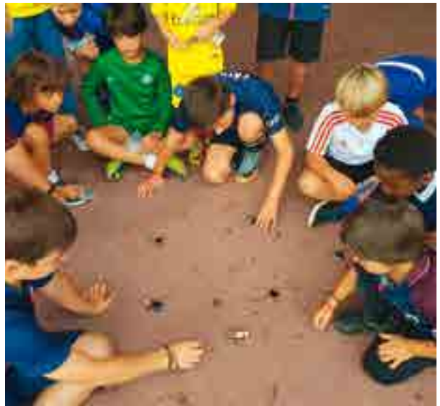
CONSTRUCTION DE MINI FORMULES 1 SOLAIRES.

Renseignements sur www.saint-mande-foot.com